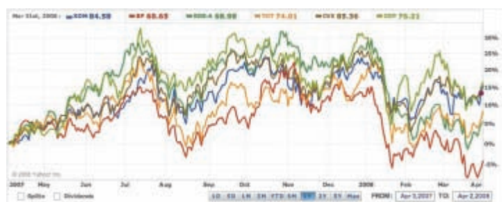
Graficul 1. Evoluția acțiunilor supermajorilor în ultimul an

Compania britanică, fostă British Petroleum, a avut venituri de 291,438 miliarde de dolari și profit net de